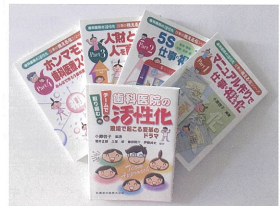
業務改革のきっかけとなった、小原啓子氏の著書。

月に1回、午前の診療を早めに切り上げて2時間の全体会議を行っている。各部門で起きている問題点と、試みている解決法を確認し合い、改善提案を示すのが目的。