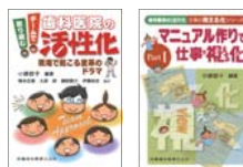
この度のセミナーは「歯科医院の活性化」「マニュアル作りで仕事の見える化」の本に準じています。

この度のセミナーでは、マニュアルを作るための準備、ミーティングの在り方、分かりやすいマニュアルを書くための工夫、マニュアルを使った人材育成プログラムの立て方など、具体的・実践的にお伝えします。