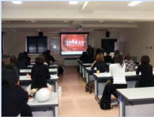
毎回、始めはテーマを変えて歯周病の基本から。