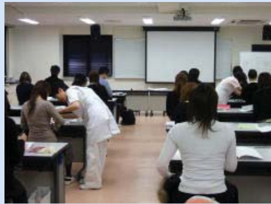
講師2名体制で、今回はじっくり実習。