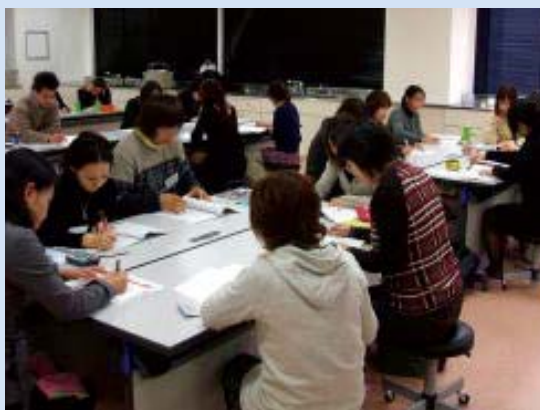
症例検討を始める前に、症例の内容の確認です。皆様真剣です。