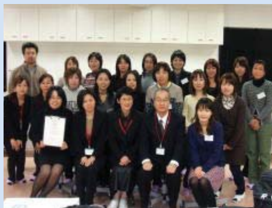
皆様、お疲れ様でした。3回どうも有難うございました。