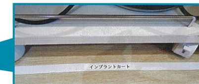
インプリントカート