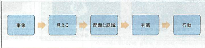
図2 改善という行動に至るまでのステップ