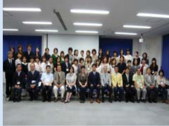
全体写真、60名ほどで無事終了。