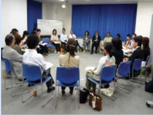
経営者・チーフ部会での情報交換。