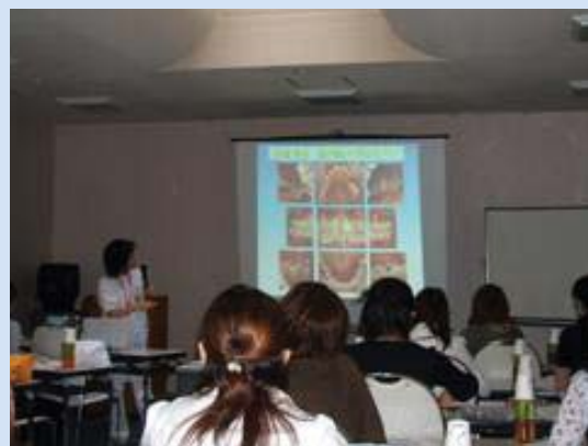
最新の情報も含んで、歯周の基本からおさらいです。