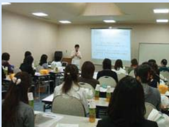
まずは小原代表から…セミナーの始まりです。