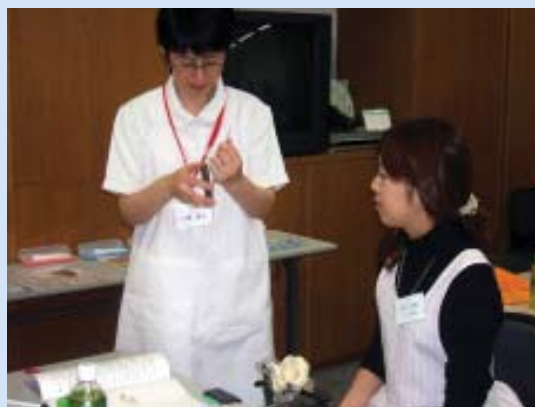
実習とはいえ、スケーラーは切れ味が大切です。