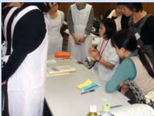
2グループに分かれてじっくり見てもらいます。