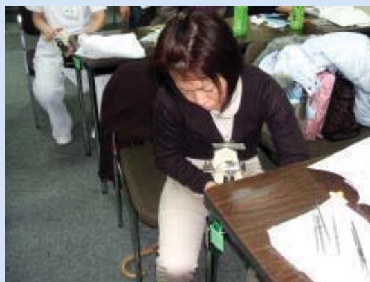
デモ後、理解しただけ行動に表れます。