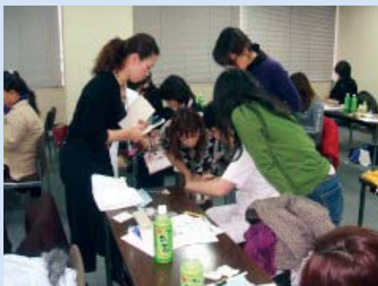
受講者の方々も真剣です。