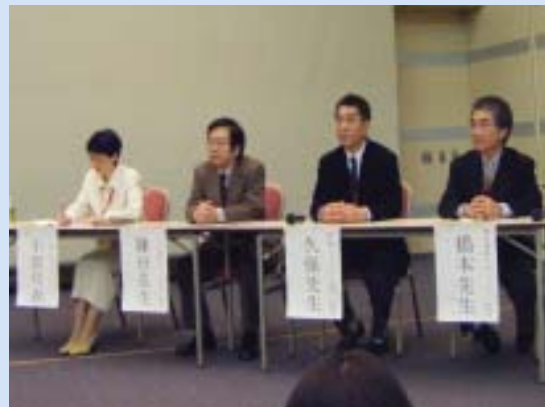
シンポジウムでは明日からの実践を意識した質問を頂きました。