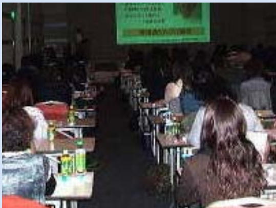
小原代表の講演からスタートです。