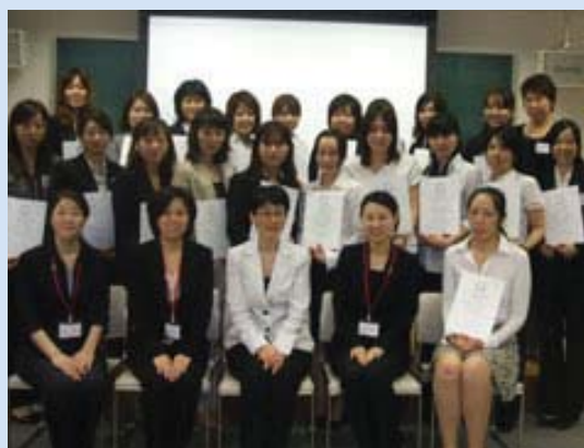
修了証を持って、集合写真です。