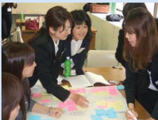
ブレインストーミングの雰囲気も和気あいあいと良い感じです