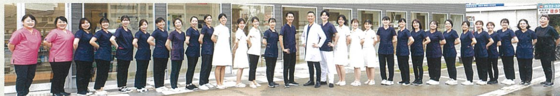
医療法人4U全スタッフ(新飯塚いとう歯科クリニックオーラルクリニック、ケアクリニック、あいはデンタルクリニック)